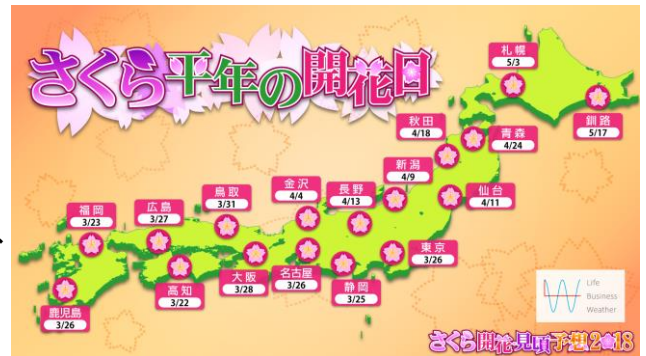
全国主要都市 さくら平年の開花日

さくらの花芽は秋から冬の寒さで目を覚まします。これを「休眠打破」といい、秋から冬の気温が低いと休眠打破が進み、春先の気温が高くなれば、さくらの花芽は順調に成長します。この秋から冬にかけては、偏西風が蛇行した影響で、寒気がたびたび南下し、全国的に、気温が平年より低めに推移しました。このため、さくらの花芽の成長に影響する休眠打破はしっかりと行われています。ただ、2月～3月にかけても、気温がやや低い状態が続きそうです。